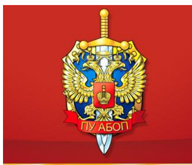
Эмблема Правового управления АБОП