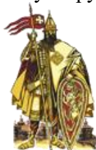
Эмблема школы Васильева в Торонто 464

С создания школы Системы Васильева в Торонто в 1993 году, накануне вывода последних советских (уж российских) войск из Германии, и началось бурное распространение Системы по всему миру.