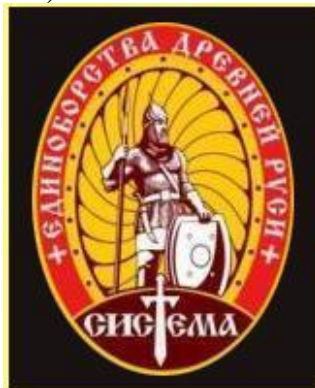
Эмблема Системы Рябко, Москва

Эмблема Система Рябко представляет собой овал с фигурой древнего воина и с надписью «Система. Единоборства древней Руси». На некоторых эмблемах имеется аббревиатура ЕДР (вызывающая прямые ассоциации с названием партии «Единая Россия»)